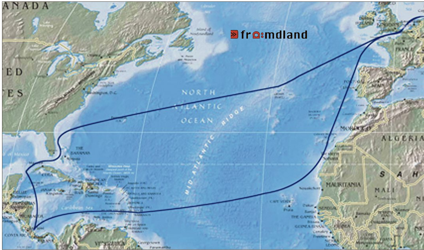
Die Reise führte die KUS-Besatzung zu den Kanarischen Inseln über den Atlantik in die Neue Welt. Neben der Karibik erkundeten die Schüler Guatemala, Costa Rica, Panama und Kuba. Zurück geht's über die Bahamas, Bermudas und Azoren nach Deutschland.