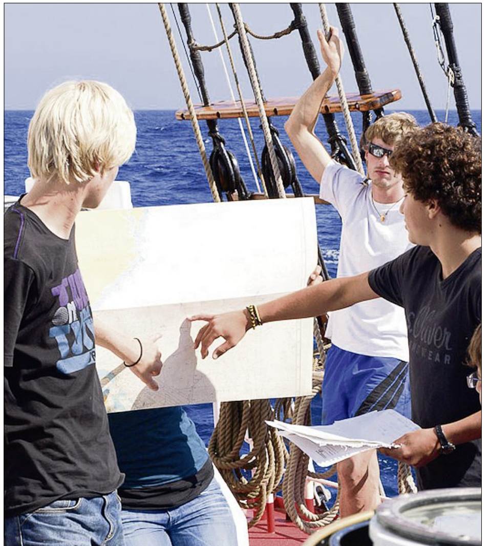
Die Schüler der KUS-Besatzung übernehmen die Schiffsleitung. Auch ohne GPS-Signal mussten sie die richtige Route finden.

Am 23. April wird unser Abenteuer vorbei sein. Wir werden nicht als Kinder, sondern als junge Erwachsene, die die Welt gesehen haben, zurückkehren.